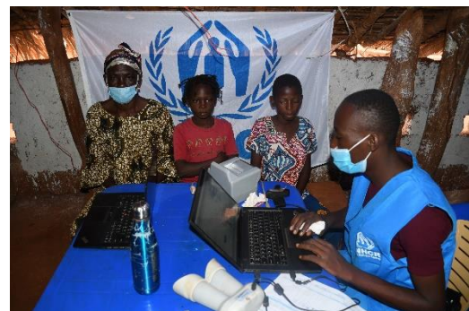
Le HCR et la CNR enregistrent des nouveaux réfugiés à Ndu, Bas Uele

Un enregistrement biométrique des réfugiés est en cours dans plusieurs localités le long de la frontière. Au 8 février 2021, le HCR et la CNR ont enregistré biométriquement un total de 7 488 ménages comprenant 26 137 nouveaux demandeurs d'asile de la RCA.