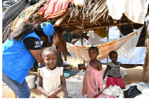
Plusieurs enfants non accompagnés sont arrivés à Satema, province du Nord Ubangi. Ils vivent avec des familles dans des abris de fortune